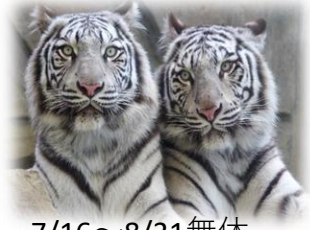
7/16～8/31無休 その他は確認要